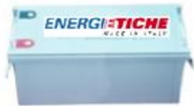
BATTERIE DA 12 VOLT -200 Ah